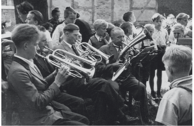
Posaunenchor Altentreptow im Jahr 1951

Nach dem 2. Weltkrieg gab es allenthalben ein kirchliches Erwachen. Die Posaunen wurden neu entdeckt. Der Superintendent Johannes Zitzke setzte sich 1950 zielstrebig für die Gründung ei-