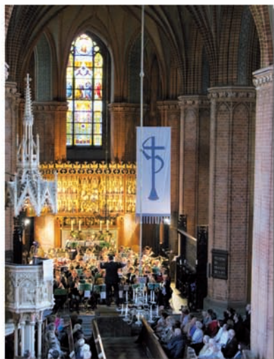
60 Jahre Posaunenchor