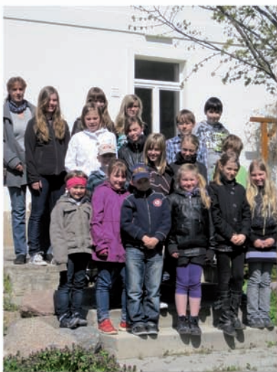
Kindertage in den Osterferien