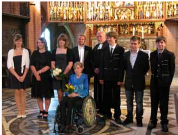
Konfirmation Pfingsten 2011