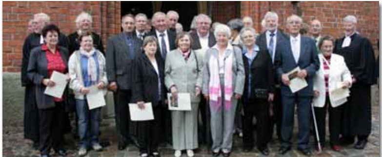
Goldene- & Jubelkonfirmation